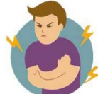
Боли в мышцах и суставах